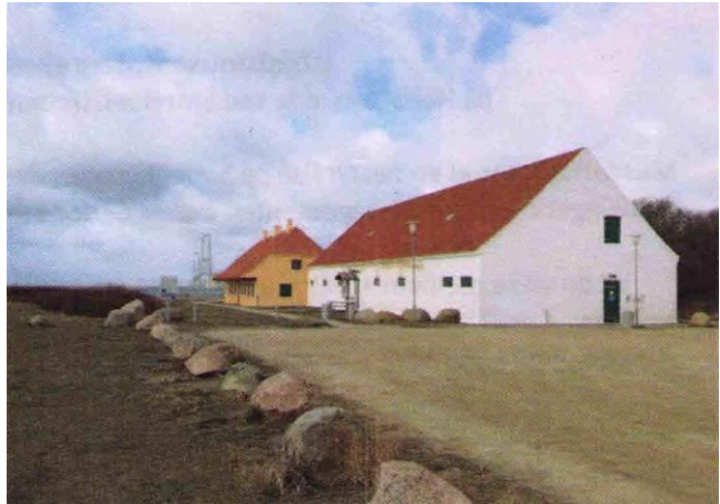
Isbådsmuseet på Halskov Odde Storebæltsvej 122, 4220 Korsør